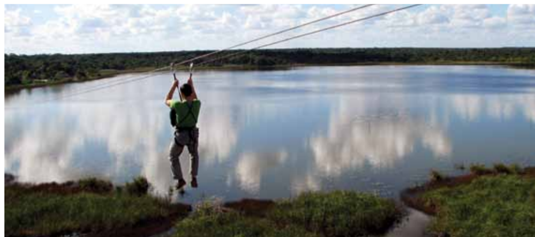
> Lynu per ežerą, kuriame gyvena meksikos krokodilai.