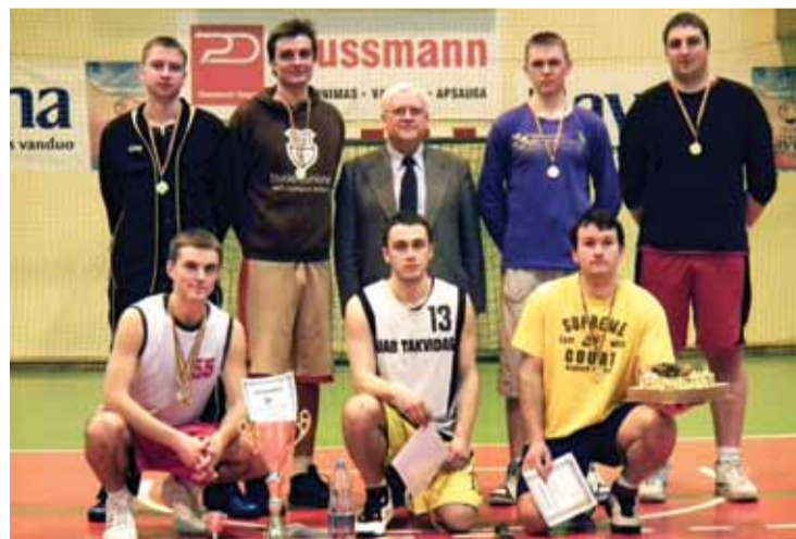
> GMF dekanų vyrų krepšinio turnyro čempionai - „Extra-Šampinjoni“

Finale dėl trečiosios vietos susikovė „Inkaras“ bei „Tamsos“ komandos. Po labai atkaklios kovos III vietą užėmė komanda „Inkaras“, rezultatu 49:42 įveikusi IV vietoje likusius „Tamsos“ koman-