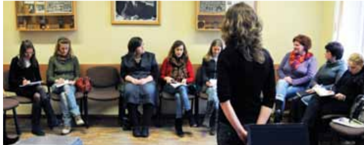
> Praktiniai užsiėmimai.

LEU surengta nacionalinė mokslinė-praktinė konferencija „Psichologų, dirbančių švietimo sistemoje, geroji darbo patirtis, metodai ir inovacijos“. Konferenciją organizavo LEU UMF Psicholo-