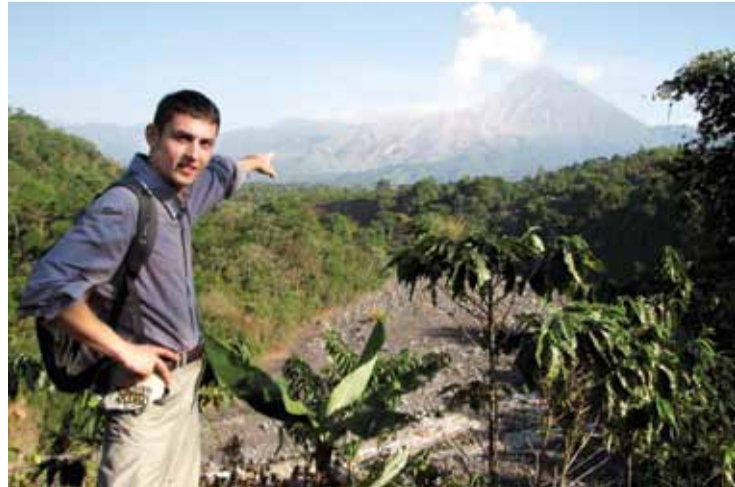
> Gvatemaloje. Vaizdas į besiveržiantį Sangujito ugnikalnį.