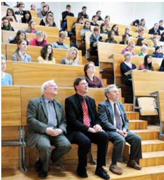
> Renginių Žemės dienai paminėti. LEU bendruomenė.

Antroji renginių ciklo diena turtinga studentų paruoštų pranešimų gamtosaugos tematika, taip pat buvo galima stebėti filmą apie gamtą. Na, o trečiąją dieną iš požieminio snaudulio visus išjudino Protų mūšis.