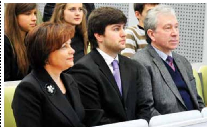
> KAM ministrė Rasa Juknevičienė.