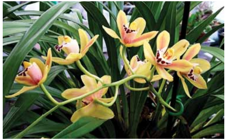
> Visi augalai - net patys nuodingiausi - yra naudingi.

Geriausių rašinių autoriai kviečiami į Augalų žvadienio šventę Lietuvos edukologijos universiteto Gamtos mokslų fakultete 2012 m. gegužės 18 dieną.